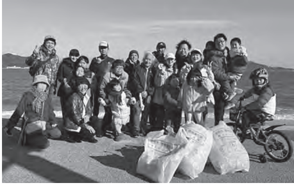
▲親子でビーチクリーン in 今宿のみなさん