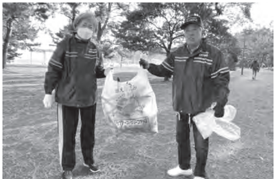
▲公園愛護会のみなさん

ていきました。家族で参加している方も多く、今回の参加者はお母さんに抱っこされて25名ほどでした。年齢層もさまざま、よい異世代交流になっていると感じました。