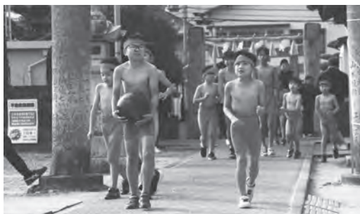
▲ 町内を回り終え神社に帰った子ども達