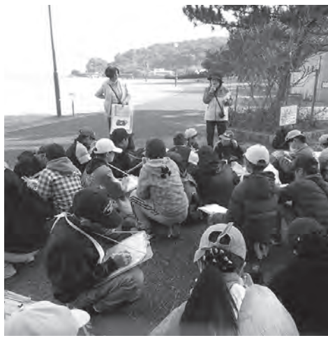
▲元寇について熱心にきく子ども達

皆精いっぱい元気に走り抜きました。ご協力ありがとうございました。今宿校区子ども会育成部