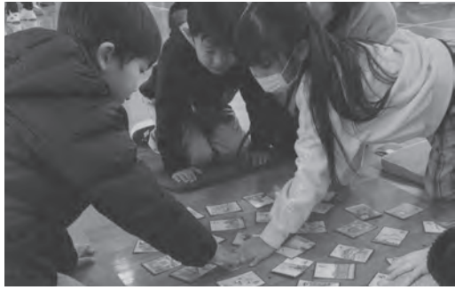
▲どっちが早かったでしょうか?!

「筑前今宿歴史かるた」を使い、低学年・中学年・高学年に分かれ、個人戦で戦います。取った総数で順位を決めます。