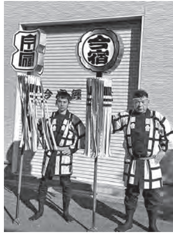
▲新しくなったまとい