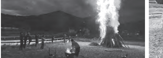
▲ 叶岳を背景にしたほうげんぎよう

鬼押しが鬼を追う。今年、鬼押しが鬼を追う。今年、鬼押しが鬼を追う。今年、鬼押しが鬼を追う。