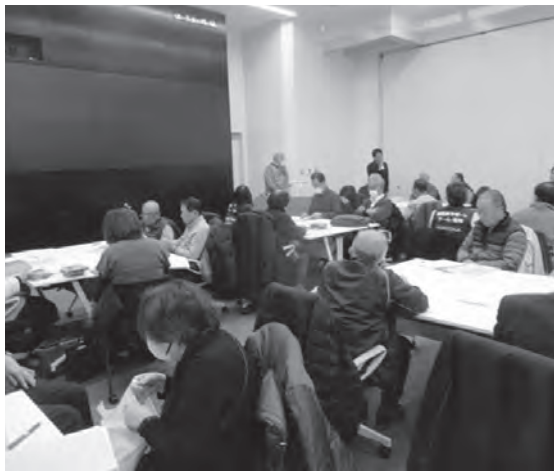
▲福岡市の地区タイムライン作成ワークショップ

3月20日は福岡県西方沖地震から20年となります。福岡市では地域における防災力の向上を目的に、昨年12月19日と今年2月5日に「地区タイムライン」作成ワークショップを行いました。