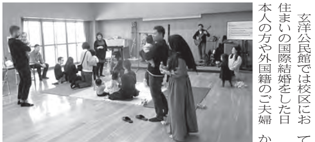
▲1月のイベントでも多くの方で賑わいました!!

1月25日(土)午前10時から12時まで開催された交流会では親子31人が参加し、ミニコンサートやおもちゃ作りなどが行われ、楽しい時間を過ごしました。交流会にご興味のある方は玄洋公民館までお問合せください。次回の開催日等の詳細についてお知らせいたします。