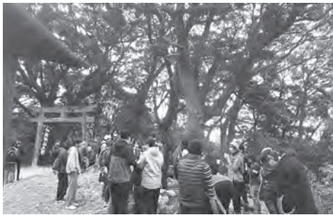
▲ 山頂本殿前の焚き火に集まる