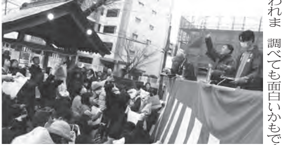
▲ 年男年女の人の豆まき

横町祇園神社では、1月26日に3mある大きなお多福面が鳥居に取り付けられました。今年、お多福面が鳥居に取り付けられました。