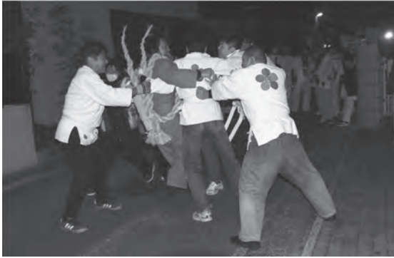
▲ 大勢で鬼押しをした上町天満宮鬼すべ祭

10箇所の接待所を廻った後、上町天満宮に帰ってきた。松の木の燃え盛る焚火に、鬼押しが鬼を追う。今年、鬼押しが鬼を追う。今年、鬼押しが鬼を追う。