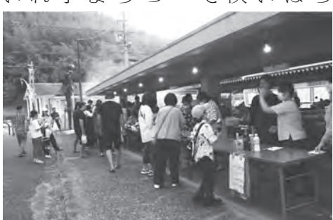
▲ 駐輪場に多くのお店が並ぶ西浜町内夏まつり

今年的美浜ふれあい夏祭りは8月17日、まだ酷暑の余熱冷めやらぬ夕刻から開催されました。夏祭りのキャッチフレーズにある「子ども達に思い出を、お年寄りには元気を、広げよう故郷美浜の輪」のとおり、小学校1年生から卒業間近の高齢者まで、元気に参加。演目は20余におよびフルート・大正琴・ハーモニカエレキギター・アコーディオン・和太鼓の演奏、カラオケ、コーラスの音楽系と少林拳、舞踊、フラダンス等舞踏系があり、夫々日頃からの練習の成果を晴れの舞台で思う存