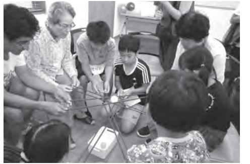
▲うまくボールを渡せるかな

参加者全員を3つのグループに分け、グループ対抗でゲームを楽しみました。今回の目玉はボールプールなどに使われるプラスチックボールと園芸用の支柱を使ったボール渡しゲームでした。高齢者と子どもが2人1組になり、支柱の上をボールを乗せ、次の人達に渡していき、最後にバケツに入れるというゲームなのですが、プラスチックボールはコロコロと転がり、思うように次の方に渡せません。