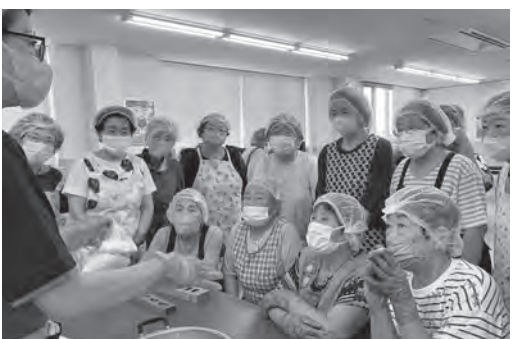
▲講師の先生の説明を聞く

よくよく調べてみると、雄花と雌花の開花時期が異なるため実がなるためには複数種の木が必要で、しかも花が咲くまでに最低5年から8年はかかるとか。もともと実を収穫すること目的ではなかったし、いまやわたしの身長をこえていて観葉植物として見てもまあいいか、と思っている今日この頃です。(Y)