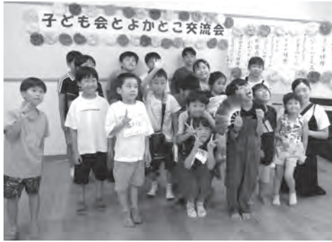
▲元気いっぱい!! 上町の子ども達

前日まで台風10号の影響が心配されていましたが、当日は快晴、暑さも再び戻ってきて、子ども会からは親子で31名もの参加があり、高齢者の方々やボランティアを合わせて44名もの参加者で賑わいました。