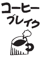
▲コーヒープレイヤ

大半のものはだいたい30センチほど育って、そこから冬を越すことができないまま枯れてしまいました。ところが1本だけ、80センチほど大きく育ったものがありました。枝もたくさん出て、葉っぱも増えてきて