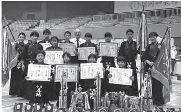
▲ 全て優勝の快挙を達成した今宿少年剣道部の皆さん