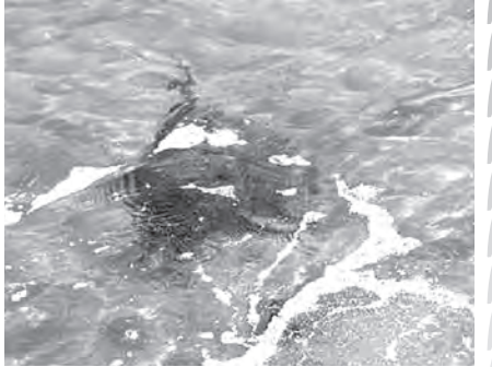
▲産卵中のカブトガニ

10時頃に親子が玄洋公民館に来館し、カブトガニを見ましたと連絡がありました。今年初めてのカブトガニ情報であり、カメラを持って