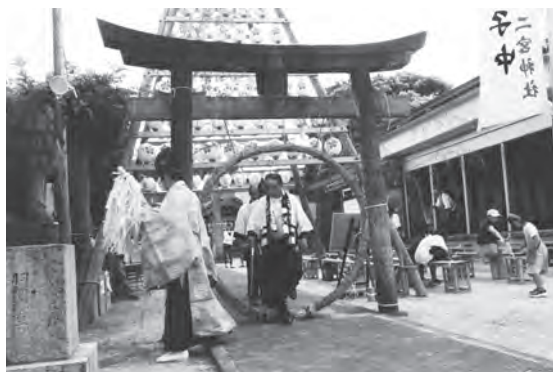
▲ 身を清める茅の輪くぐり

7月27日(土)は、半年間のお疲れや暑い夏を元気に過ごせるように祈念する二宮神社の夏越祭が行われました。今年の夏越祭は、身を清める茅の輪くぐりや子どもみこしと舞台上で演芸が行われました。 午後3時半より子どもみこしが行われました。西松原1丁目・2丁目と今宿駅前1丁目をみこしで練り歩きました。二宮神社に帰った後、みこしの担ぎ手