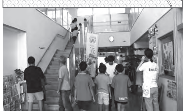
▲ロビーでドローンを飛ばす子ども達

待ちに待った夏休み。今年の夏は猛暑日が続いていますが、玄洋公民館では小学生対象のスケッチ大会・ドローン体験などいろいろな行事が目白押し。自習室の開放もあり、たくさんのお子・生徒が公民館で勉強をしています。 7月26・27日はスケッチと工作教室を行いました。2日間で小・中学生37名を