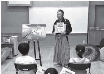
▲手品のタネを解説

り、大技が出るたび子どもも大人も歓声をあげて拍手喝采でした。最後に「花目付」という手品のタネを参加者全員にも教えてもらい、それぞれ持ち帰ることにしました。この手品は「いろはにほへと」の言葉と数字の足し算を組み合わせて行います。子どもの勉強に昔から利用されていたとか。小学生のみんなは家族や友達とやってみる、と嬉しそうでした。うまく披露することができたかな?