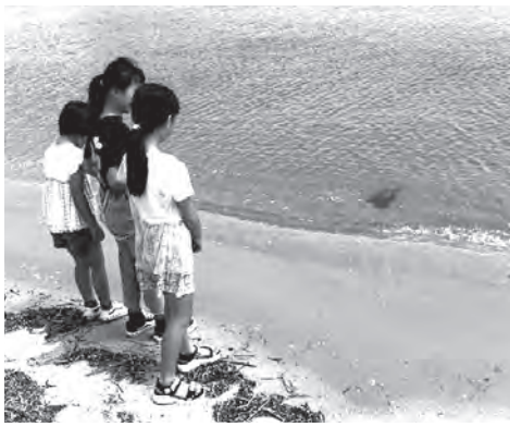
▲カブトガニ産卵を見る小学生

今津干潟は福岡市内唯一のカブトガニ産卵場として知られています。7月23日(火)に今津干潟より続いている玄洋公民館前の今宿海岸の波打ち際にカブトガニが産卵していました。