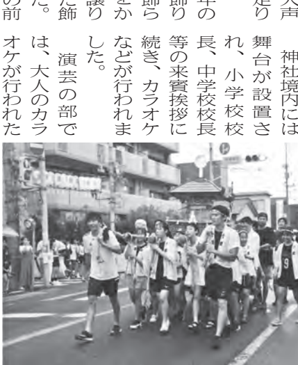
▲ 子ども昇き山も笑顔一杯!

7月14日は横町祇園神社の大祭「まつり横町」が行われました。 まつり横町が行われる14日の天気は、幸いにも雨は止み午後5時より予定通り行事が行われ、子ども達はお汐井取りの後、子ども山笠が展示されました。 各所の接待所では勢水でび