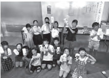
▲きれいにできました!

り、大技が出るたび子どもも大人も歓声をあげて拍手喝采でした。最後に「花目付」という手品のタネを参加者全員にも教えてもらい、それぞれ持ち帰ることにしました。この手品は「いろはにほへと」の言葉と数字の足し算を組み合わせて行います。子どもの勉強に昔から利用されていたとか。小学生のみんなは家族や友達とやってみる、と嬉しそうでした。うまく披露することができたかな?