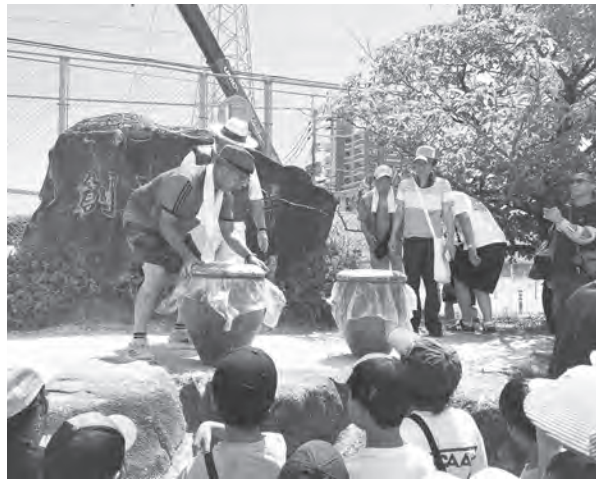
▲ 2つのタイムカプセル(かめ)に拍手喝采の子ども達!!