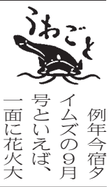
例年今宿タイムズの9月号といえば、一面に花火大会の写真。それを見て過ぎし夏を振り返る、というのが定番だった。昭和58年から続いてきた今宿の花火大会も、ついに昨年の開催を最後として、39回の歴史に幕を閉じた。淋しさを感じている人は多いだろう。